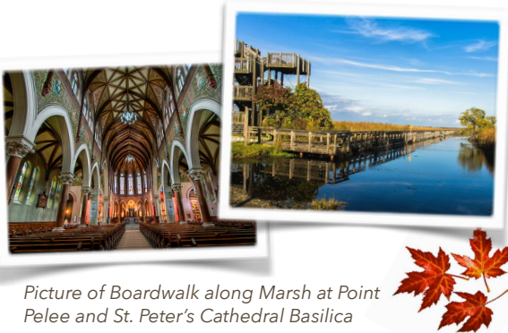
Picture of Boardwalk along Marsh at Point Pelee and St. Peter's Cathedral Basilica